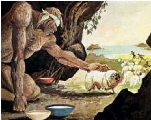
Μύρων Μηναδάκης και Αγγελική Μελεσσανάκη

και επίσης λέει ότι είναι πιο δυνατός από τον πατέρα των θεών τον Δία. (Αυτά φαίνονται από τους εξής στίχους: <<Πες μου το όνομα σου και θα σου χαρίσω δώρο φιλόξενο. (...) Τον Ούτιν θα τον φάω τελευταίο... Τώρα ξέρεις το φιλόξενο μου δώρο. )